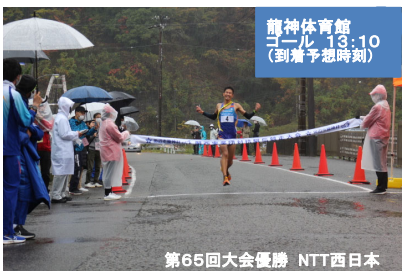
第65回大会優勝 NTT西日本

お問い合わせ先 龍神村実行委員会(龍神市民センター内) ☎0739-78-0301 ホームページアドレス 龍西実業団陸上競技連盟事務局(綿太製薬工場) ☎088-6924-7910 http://www.city.tanabe.lg.jp/ryujin/ (龍神行政局) http://www.kansai.jita-trackfield.jp (関西実業団陸上競技連盟)