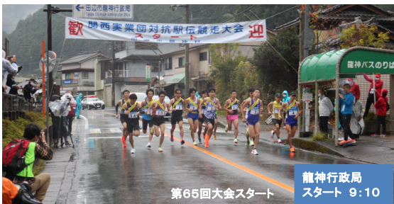
第65回大会スタート